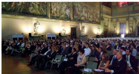
Firenze, 18 maggio 2007, Grand Prix 2005/2006