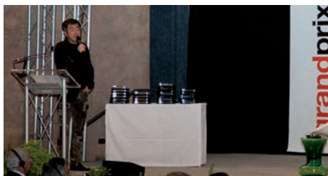
Milano, 14 aprile 2010, Grand Prix 2007/2009, Kengo Kuma, lectio magistralis