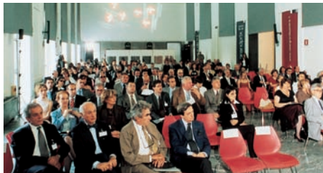
Milano, 23 maggio 2003, Grand Prix 2000/2002