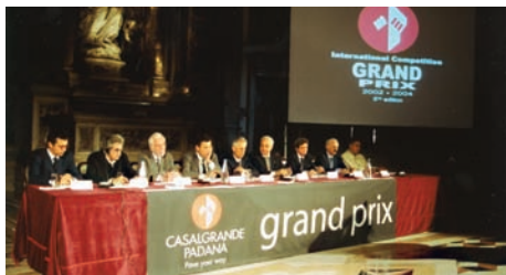
Venezia, 13 maggio 2005, Grand Prix 2002/2004