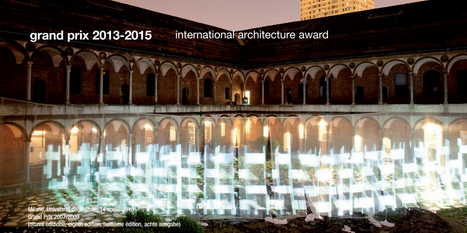
Milano, Università degli Studi, 14 aprile 2010 Grand Prix 2007/2009 (ottava edizione, eighth edition, huitième édition, achte ausgabe)