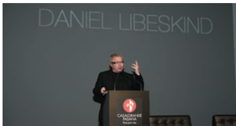
Milano, 11 maggio 2013, Grand Prix 2010/2012, Daniel Libeskind, lectio magistralis