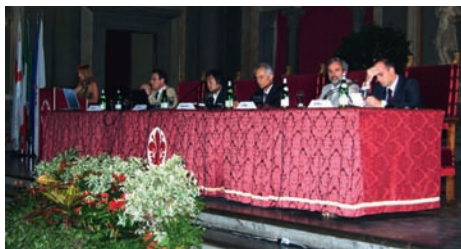
Firenze, 18 maggio 2007, Grand Prix 2005/2006