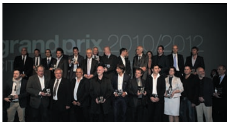
Milano, 11 maggio 2013, Grand Prix 2010/2012