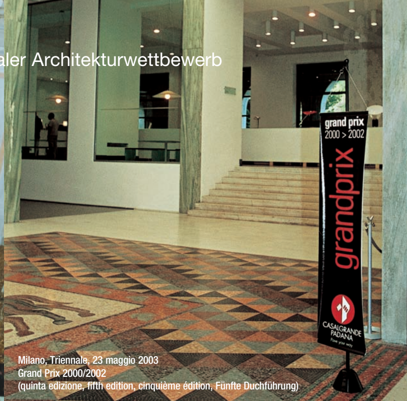
Milano, Triennale, 23 maggio 2003 Grand Prix 2000/2002 (quinta edizione, fifth edition, cinquième édition, Fünfte Durchführung)