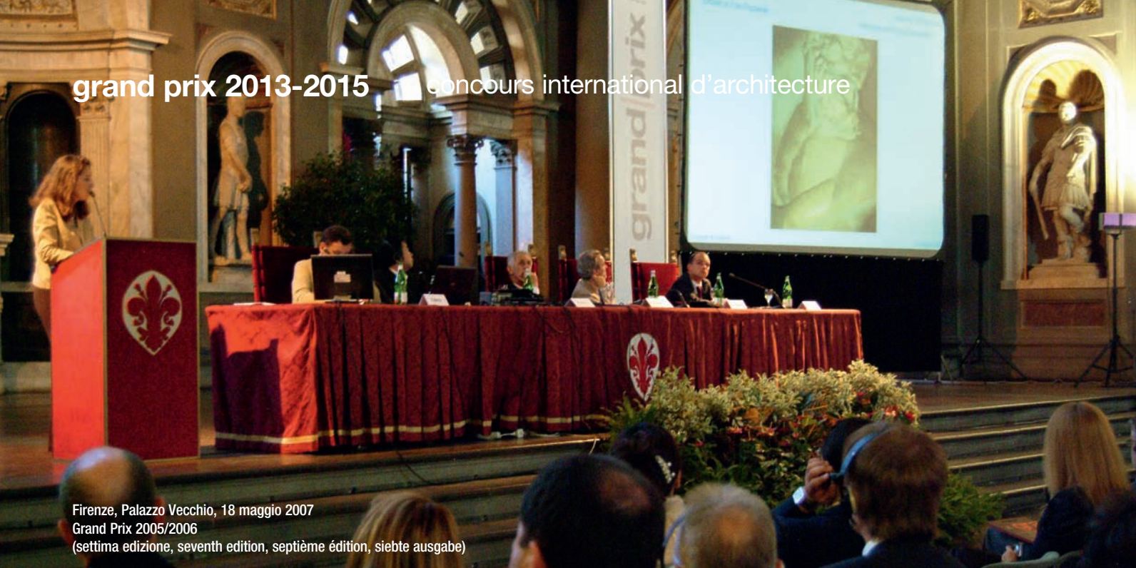
Firenze, Palazzo Vecchio, 18 maggio 2007 Grand Prix 2005/2006 (settima edizione, seventh edition, septième édition, siebte ausgabe)